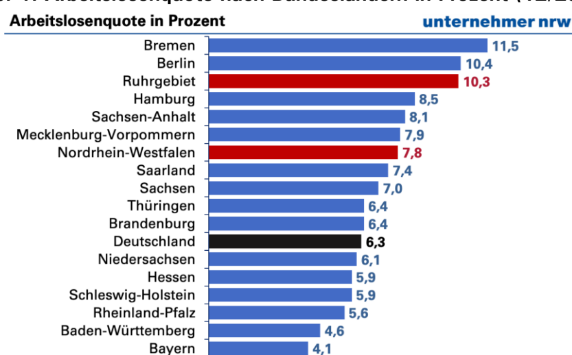
Abb. 1: Arbeitslosenquote nach Bundesländern in Prozent (12/2025)

Anmerkung: Ursprungswerte, auf Basis aller Erwerbspersonen.