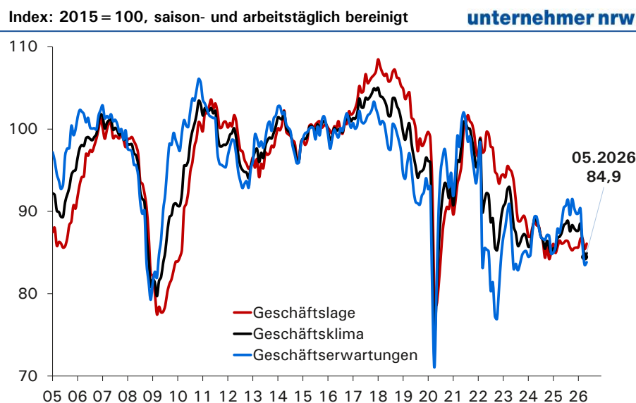
Abb. 1: ifo Geschäftsklima für Deutschland

Anmerkung: Das ifo Geschäftsklima basiert auf ca. 9000 monatlichen Meldungen von Unternehmen des Verarbeitenden Gewerbes, des Dienstleistungssektors, des Handels und des Bauhauptgewerbes.