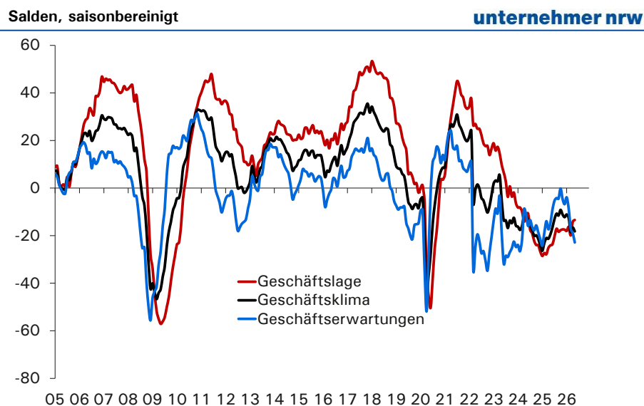
Abb. 2: ifo Geschäftsklima im Verarbeitenden Gewerbe ohne Ernährungsgewerbe

Anmerkung: Die Unternehmen werden gebeten, ihre aktuelle Lage als „gut“, „befriedigend“ oder „schlecht“ und ihre Erwartungen für die nächsten sechs Monate als „günstiger“, „gleichbleibend“ oder „ungünstiger“ zu bewerten. Der Saldowert der aktuellen Geschäftslage ist die Differenz der Prozentanteile der Antworten „gut“ und „schlecht“, der Saldowert der Erwartungen ist die Differenz der Prozentanteile der Antworten „günstiger“ und „ungünstiger“. Das Geschäftsklima ist ein Mittelwert dieser beiden Salden.