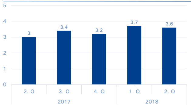
Auftragsbestand in Produktionsmonaten unternehmer nrw

Quelle: Ifo. Saisonbereinigte Werte; ohne Ernährungsgewerbe.